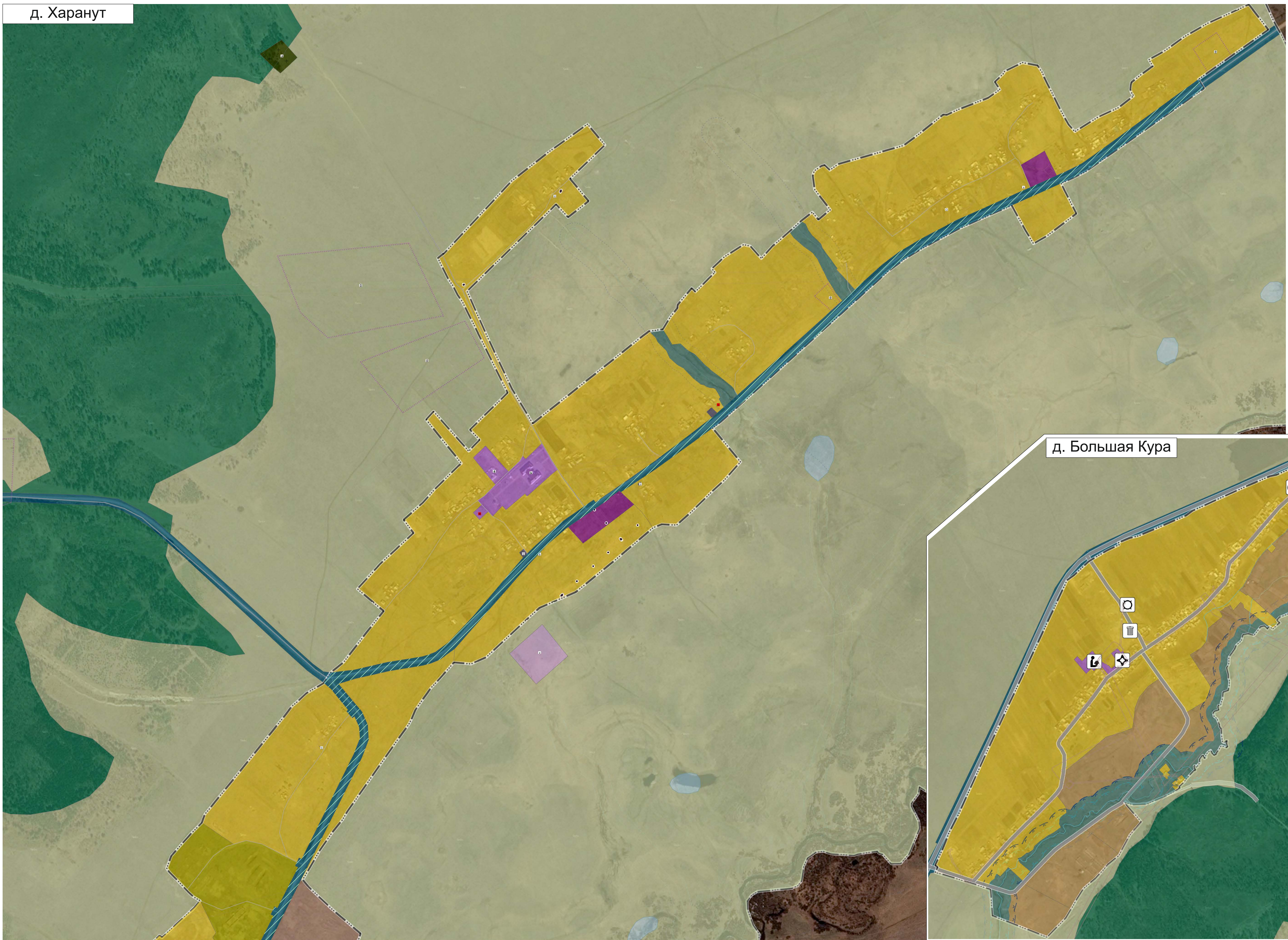
д. Большая Кура